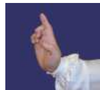
Yi Zhi Mei : un doigt (fleur d'abricot sur la branche)