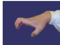
Long Zhua : main en griffes de dragon