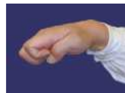
Qiang Zhi Quan : poing ave plusieurs angles d'attaque